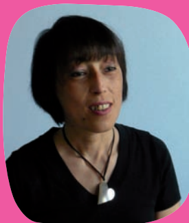
Manila 38 anni

La donna deve sottoporsi ad un prelievo di sangue periferico al momento del parto; dopo sei mesi dalla donazione, per escludere la presenza di malattie infettive trasmissibili, deve ripetere gli esami.