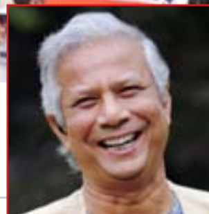
Muhammad Yunus , precursore del microcredito

Da Firenze a Siena, le esperienze di prevenzione dell'usura e microcredito